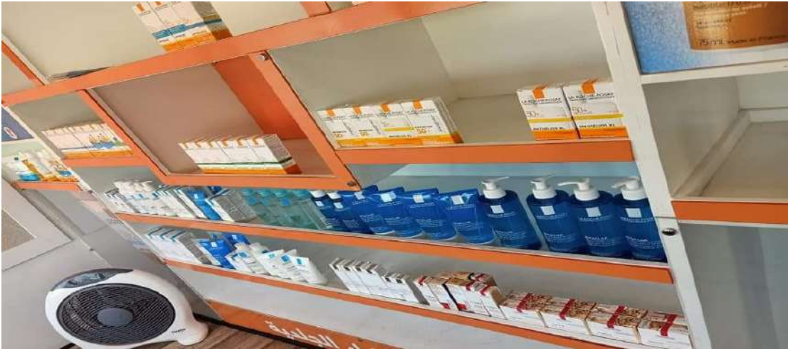
عرض احدى منتجات شركة تالانت